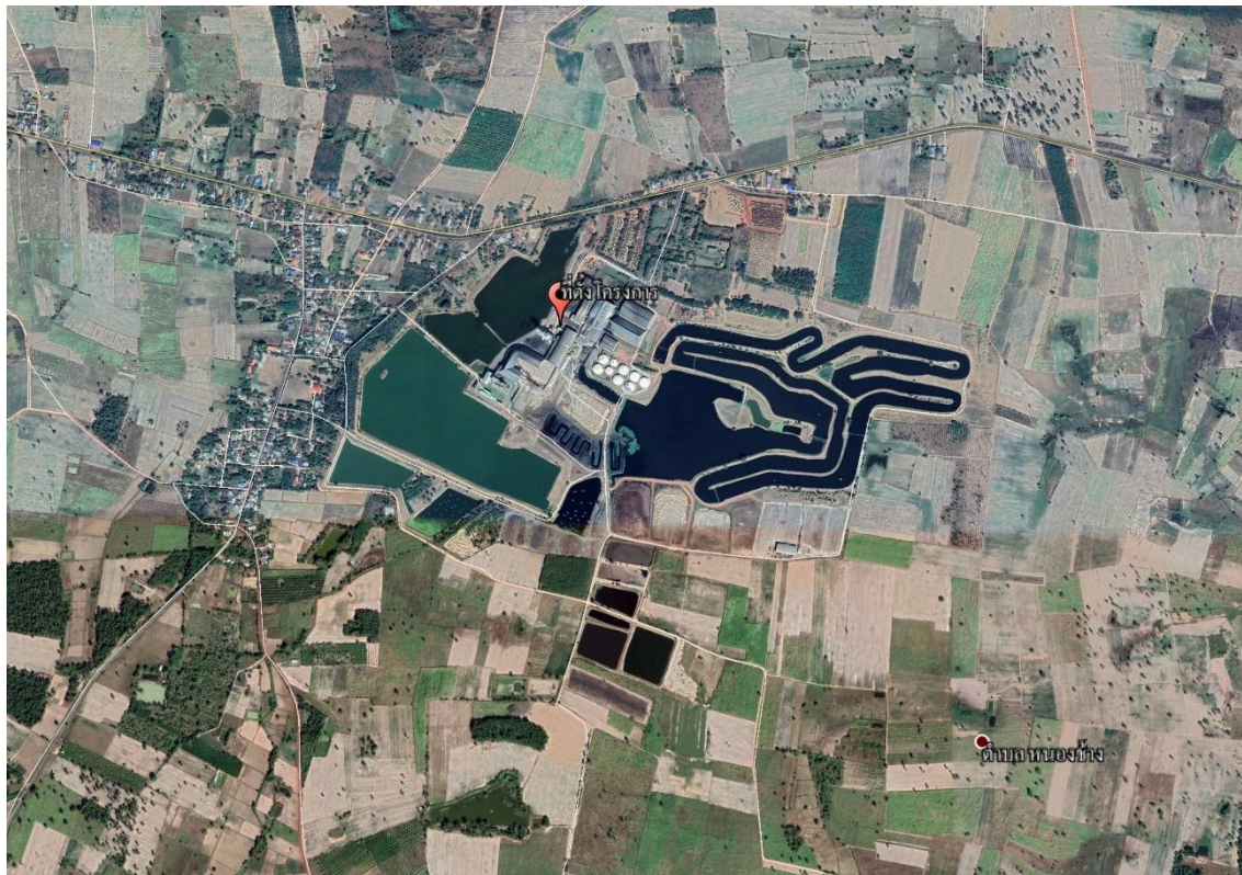
รูปที่ 1.2-1 ที่ตั้งโครงการ